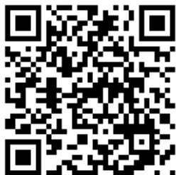
健康體育網路護照